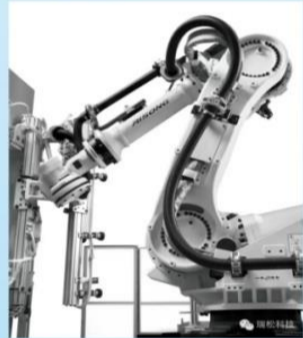
图：应用于电梯行业的智能机器人及系统集成

近20年以来，瑞松科技在机器人自动化及智能化集成装备领域有了较快发展，主要客户有： 汽车工业：广汽丰田、广汽本田、广汽乘用车、广汽菲亚特、广汽三菱、比亚迪汽车、沃尔沃、东风本田、长安汽车等汽车行业； 摩托车行业：广州五羊本田、重庆雅马哈、大长江铃木、重庆隆鑫等； 电梯行业：广州日立电梯、上海三菱电梯、天津奥的斯电梯等； IT通讯业：富士康集团、深圳华为、深圳中兴通讯等； 造船工业：广船国际、中船黄埔文冲、招商重工、中远船务、新船重工、广东粤新、广新海事、江门南洋等； 海洋工程：深圳胜宝旺、中海石油等。