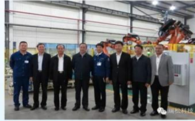
中央政治局委员、广东省委书记胡春华一行领导莅临调研！

一直以来，瑞松科技得到国家、省市级政府领导以及各相关行业的关怀与支持：国家工信部、广东省经信委、广州市政府、国家机械工业联合会、中国机器人协会、中国机器人产业联盟、广州市机器人产业联盟、广东省制造业协会、广东省汽车行业协会、广东省机械工程学会、广东省焊接学会等各级部门和领导相继莅临瑞松科技考察、调研和指导工作。