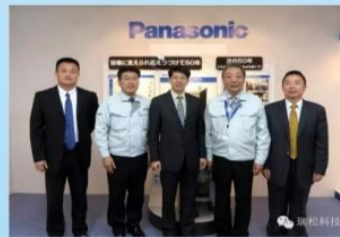
公司高管在日本松下总部！

——作为中国机器人协会的创会单位及中国自动化学会机器人专业委员会理事单位，瑞松科技一直保持与日本、德国、美国等国际知名机器人公司进行交流与合作，分别与日本松下、日本北斗、德国KUKA、德国IBG等建立了资金、技术、人才、市场等领域的战略合作伙伴关系，引进和运用世界尖端技术并转化为自身生产力，努力创新，推动机器人及智能技术领域自动化、智能化的技术创新，促进智能科技和工业水平的快速发展。目前，瑞松科技机器人与智能装备及3D打印研发生产基地项目已被广州市纳入重点项目。