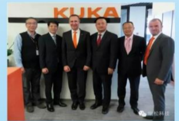
公司高管在德国KUKA机器人总部！