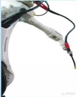
图：技术领先的焊接机器人及智能技术

瑞松科技的机器人、智能技术以及系统集成业务在中国位居前列。在业务覆盖的范围内，瑞松科技已建立起紧密的销售服务网络，广泛地向汽车、摩托车、电梯、高铁、航空、造船、海洋工程、机械和IT通讯等领域的国内外用户提供高性能优质产品与服务。自1997年为广州五羊-本田摩托车有限公司提供第一条机器人焊接自动化生产线，至今已为制造业提供了各系列机器人4000多台，承接近千套机器人系统及焊接自动化生产线。