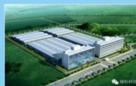
占地20000平方米的瑞松科技园正在建设中！

瑞松科技已通过ISO9001质量管理体系、ISO14001环境管理体系及安全生产标准化的认证。通过多年的积累沉淀，瑞松科技已形成了自有的先进管理标准体系，实施精细化、信息化管理，实行创新激励及考核机制，并按企业上市规范进行风险控制和内控管理。目前，瑞松科技拥有诸多的发明专利和实用新型专利，相继被评为“2013年广东省自主创新示范企业”、“2013年度广东省优秀信用企业”，“2013年度广东省最佳雇主”，2014年获得“高新技术企业”称号。——瑞松科技研发开发人员占总人员35%，拥有一支掌握国内、国外尖端技术的研发团队。