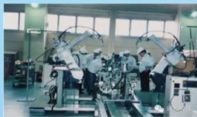
图：1997年五羊-本田摩托车项目案例