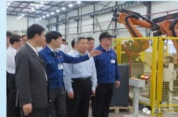
广东省人大常委会主任黄业云、广州市市长陈建华一行领导莅临调研！

——作为中国机器人协会的创会单位及中国自动化学会机器人专业委员会理事单位，瑞松科技一直保持与日本、德国、美国等国际知名机器人公司进行交流与合作，分别与日本松下、日本北斗、德国KUKA、德国IBG等建立了资金、技术、人才、市场等领域的战略合作伙伴关系，引进和运用世界尖端技术并转化为自身生产力，努力创新，推动机器人及智能技术领域自动化、智能化的技术创新，促进智能科技和工业水平的快速发展。目前，瑞松科技机器人与智能装备及3D打印研发生产基地项目已被广州市纳入重点项目。