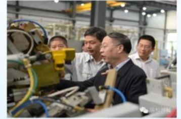
国家工信部副部长苏波一行领导莅临调研！