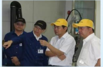
国家发改委副秘书长范恒山一行领导莅临调研！